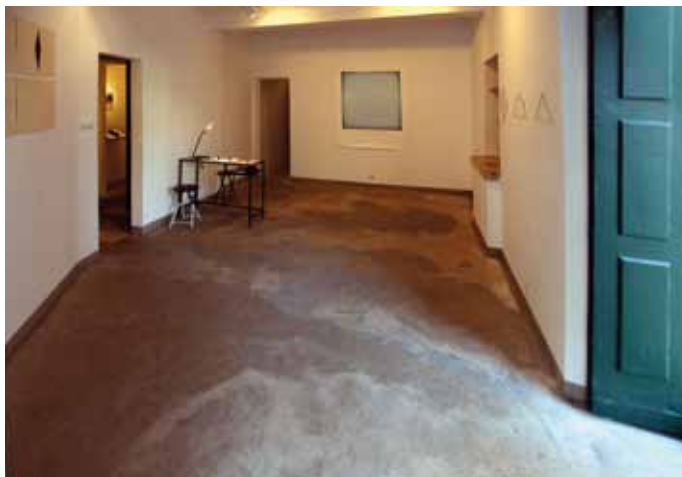
◀ Marta Alvim. A strange form of life (vista da exposição), 2015