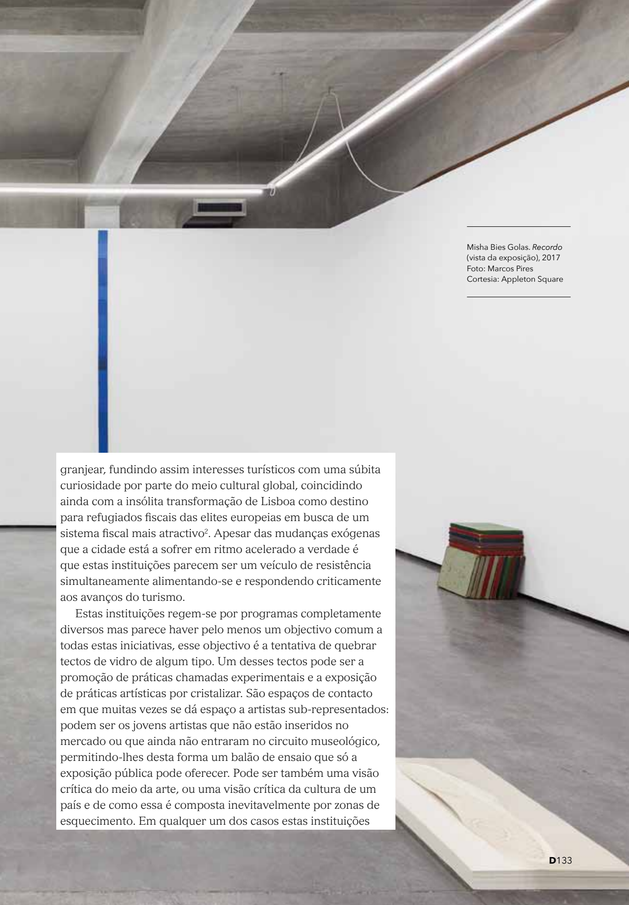
Misha Bies Golas. Recordo (vista da exposição), 2017

granjejar, fundindo assim interesses turísticos com uma súbita curiosidade por parte do meio cultural global, coincidindo ainda com a insólita transformação de Lisboa como destino para refugiados fiscais das elites europeias em busca de um sistema fiscal mais atractivo 2 . Apesar das mudanças exógenas que a cidade está a sofrer em ritmo acelerado a verdade é que estas instituições parecem ser um veículo de resistência simultaneamente alimentando-se e respondendo criticamente aos avanços do turismo.