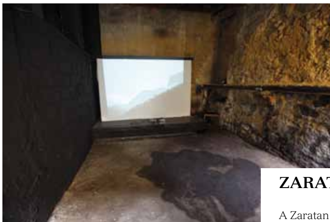
◀ Charcoal room 2