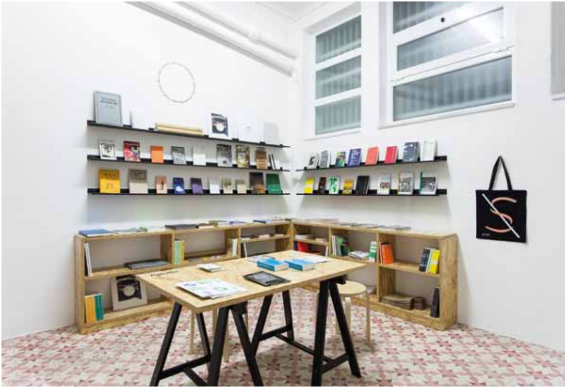
Syntax Bookshop