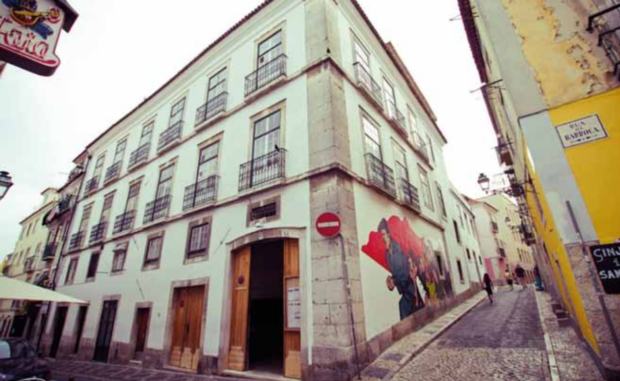
Vista exterior da galeria Zé dos Bois

Rua da Barroca, no 59 1200-049 Lisboa Portugal www.zedosbois.org